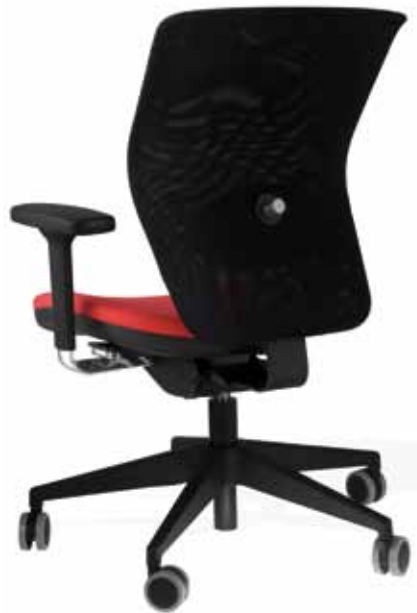
Versione girevole Rete