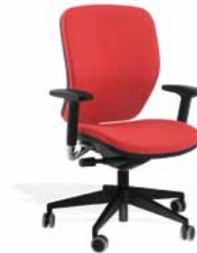
Girevole tappezzata / Swivel upholstery version