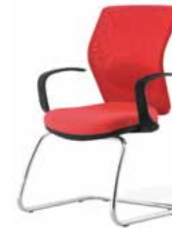
Visitatore rete / Visitor net version