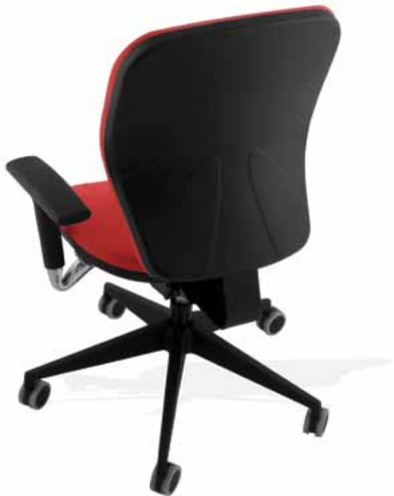
Swivel upholstery version