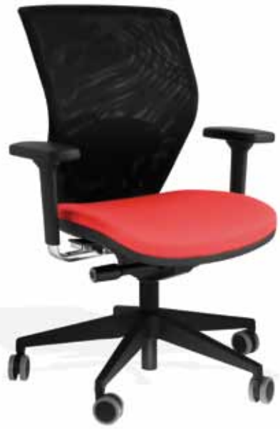
Swivel net version