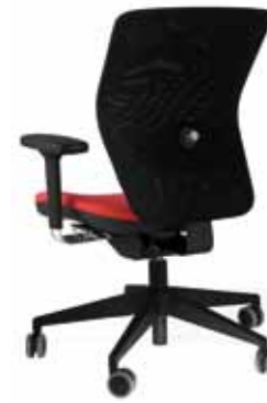
Girevole rete / Swivel net version