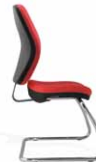
Visitatore tappezzata / Visitor upholstery version